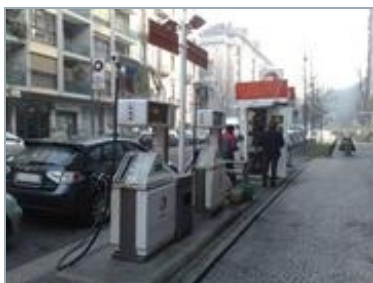
MILANO Via Correggio